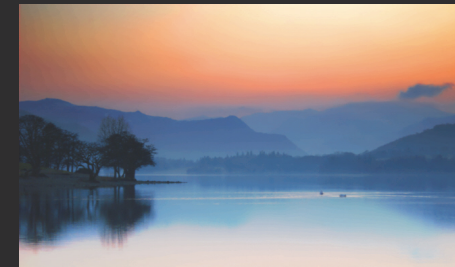
'Ullswater Reflections' © Mark Heim

Créez des œuvres d'art incroyables grâce à de nombreuses techniques et outils professionnels mis à votre disposition : système de calques, masque de calques, détourage, filtres et effets.